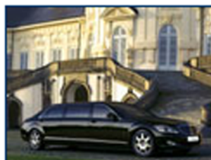
Mercedes S 600 Guard Pullman L