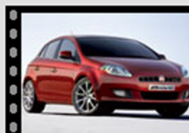
Nuova Fiat Bravo