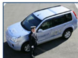
Il Noleggio Con Conducente di un'auto ad idrogeno