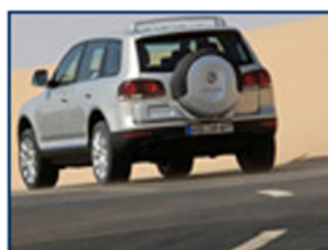
Volkswagen Touareg 2007