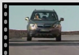
Nuova Opel Antara