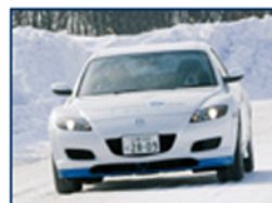
La Mazda RX-8 Hydrogen RE... al freddo