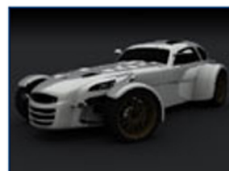
A Ginevra la Donkervoort D8 GT