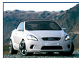
Kia ex_cee'd concept