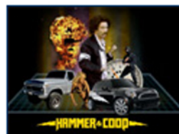
Mini USA lancia "Hammer &amp; Coop"